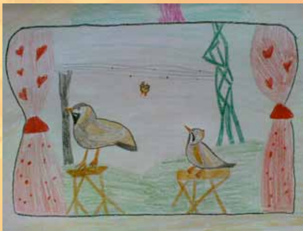
Rys. Amelka Krawiec, lat 8

dwie przepiórki i nad nimi ja szaro-bura przepiórkowa królowa