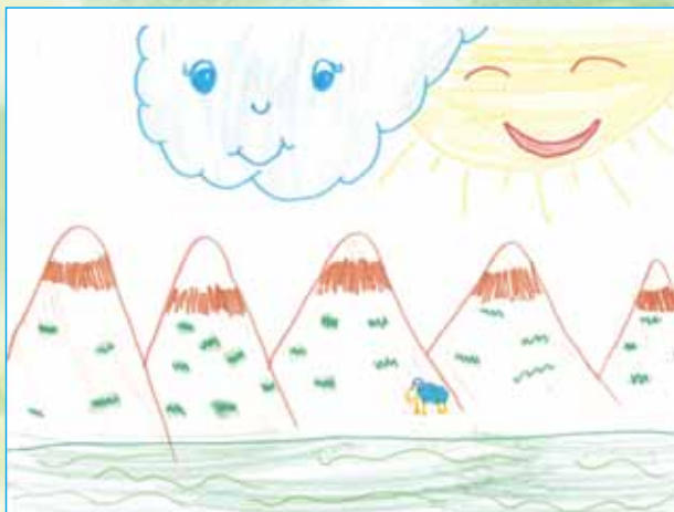
RYS. OLA BRONIEWSKA, LAT 7

Był obłok i rozwiął się nagle, w złotym słońcu srebrzystym żaglem.