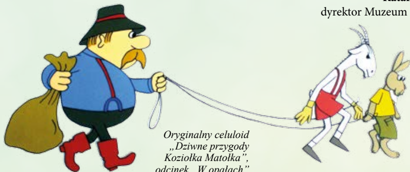
Oryginalny celuloid „Dziwne przygody Koziołka Matołka”, odcinek „W opalach”