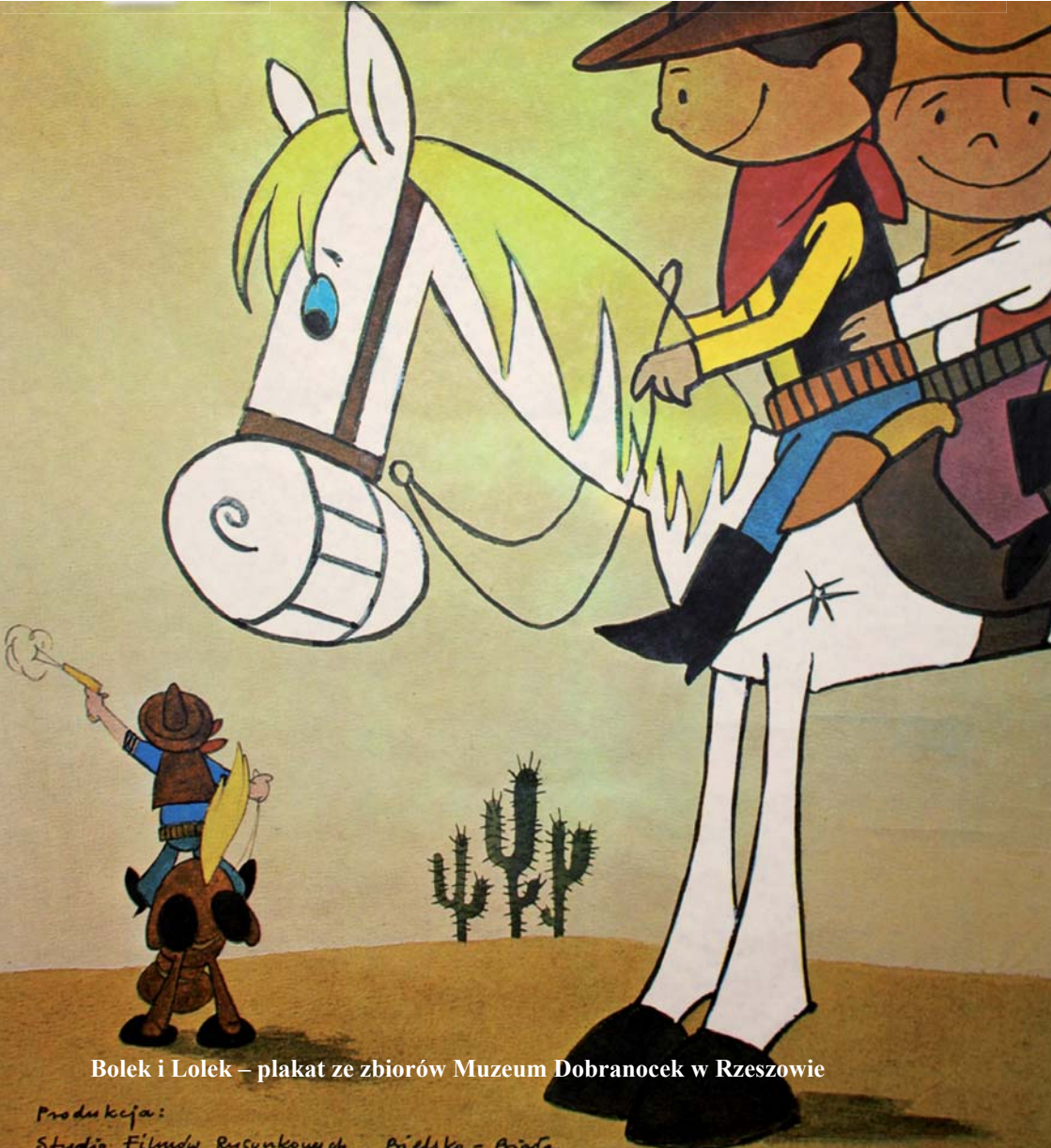
Bolek i Lolek – plakat ze zbiorów Muzeum Dobranoczek w Rzeszowie

Produkcja: Studio Filmów Rysunkowych Piłki - Piłki