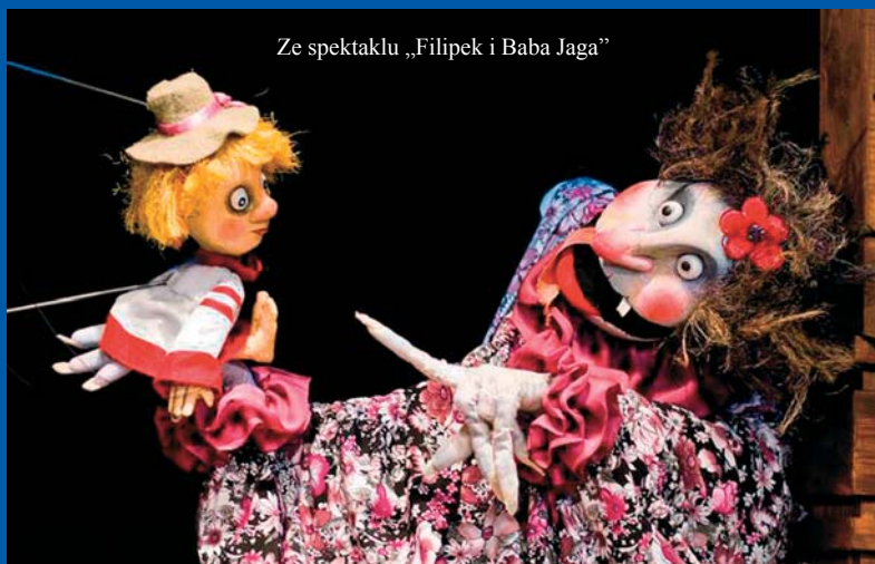
Ze spektaklu „Filipek i Baba Jaga”

Dawno, dawno temu żyli sobie dziad i baba. Pewnego dnia mężczyzna przyniósł kobiecie kawałek drewna, który niespodziewanie ożył i stał się małym chłopcem Filipkiem. Wniósł on szczęście w życie staruszków. Beztraska nie trwała jednak długo. Baba Jaga rozzłoszczona, że ktoś ośmielił się łowić ryby w jej stawie, postanowiła zjeść Filipka na obiad. W jaki sposób uda się chłopcu wyjść z kłopotów? Jak wykorzysta pomoc gęsi? W przedstawieniu odnajdujemy motywy z „Pinokia”, „Jasia i Małgosi” czy „Paluszka”. Pomysłowy chłopiec uczy rozwiązywania problemów sprytem i zaradnością.