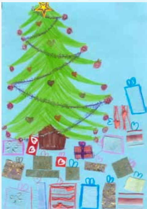
Rys. Dominika Pitera, lat 8