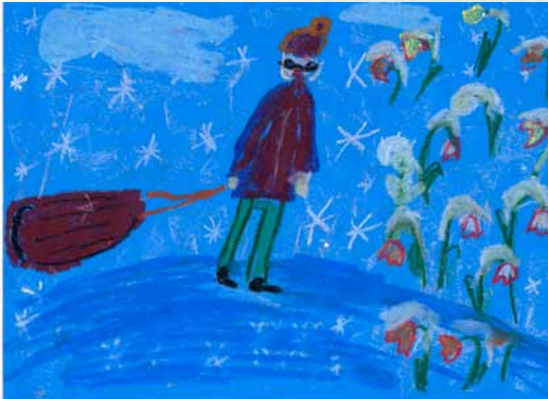
Rys. Gabriel Walawender, kl. 2a, SP nr 1 w Rzeszowie

Prowadząca: Na zimę przyroda zasypia. Niektóre zwierzęta chowają się w swoich norach, moszczą sobie legowiska i zasypiają. Drzewa pozbawione liści wystawiają na wiatr tylko brązowe gałęzie, śpią. Trawniki przykrywa biały śnieg. W ziemi śpią korzonki i cebulki kwiatów,