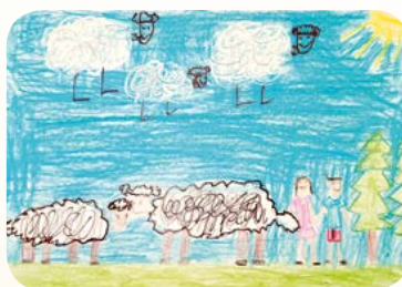
Rys. Aleksander Nowak