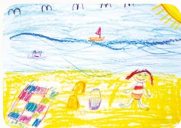
Rys. Zuzia Fluda