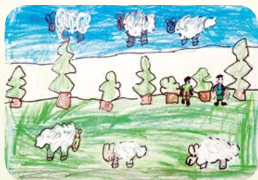
Rys. Wiktor Kloda