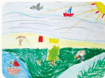
Rys. Kaja Rogala

Bo to było lato, jedliśmy truskawki w ogrodzie pod niebem, gdzie się owce pasły.