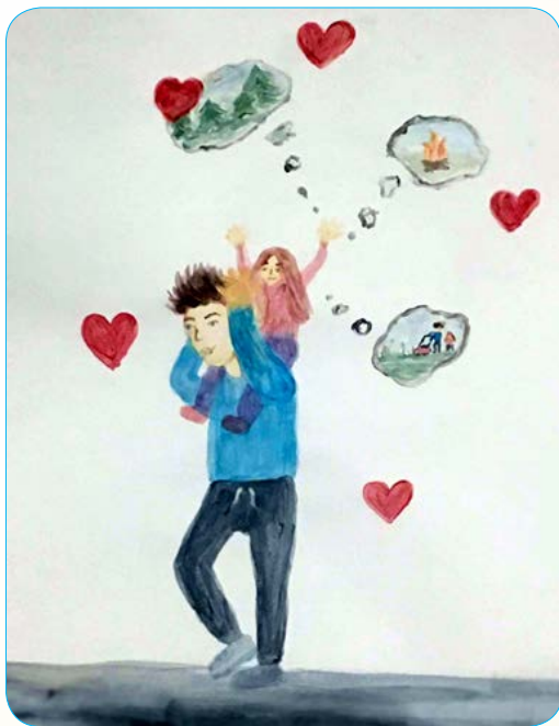
Rys. Wiktoria Nycz