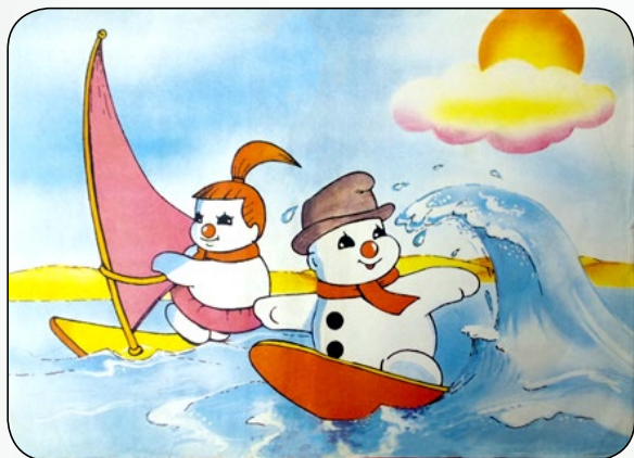
Plakat z czasopisma „Bouli”.

Wakacje to czas odpoczynku, małych i dużych podróży oraz zabawy. Zapraszam do skorzystania z letniej oferty Muzeum Dobranocek w Rzeszowie, która łączy możliwość spędzania wolnego czasu, zdobywania wiedzy, rozwoju umiejętności oraz dobrą zabawę. Uczestnicy zajęć będą mogli poznawać przygody bohaterów kultowych