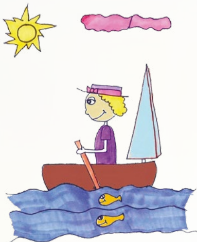
Rys. Emilia Paulukiewicz

Jeszcze pachną akacje, jadą, jadą wakacje. Będę leżeć na kocu bardzo, bardzo leniwie, aż wyobraźnia zacznie swe podróże szczęśliwe. Już oto łodzią srebrzystą powoli najpierw sunę w przejrzystą, błękitną lagunę. I tylko mama się dowie, gdzie złote rybki łowią. A teraz płyną pod okiem puszyste, różowe obłoki. Na ich strzępiastym grzbiecie mogę daleko polecieć. Kraina baśni mnie wzywa, to podróż niezwykła, to podróż prawdziwa.