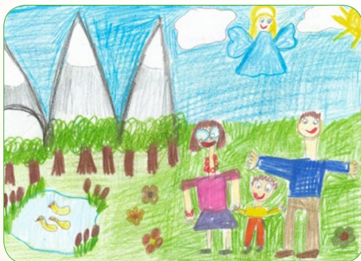
Rys. Alan Węgrzyn

Jeszcze wielu łask Bożych na jutro potrzeba – dobry Anioł dołoży kawałeczek Nieba!