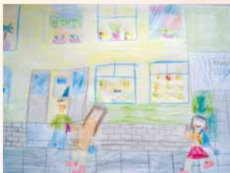
Rys. Julia Morlak, lat 9, SP nr1 w Rzeszowie

Kiedy porą zimową śnieg przysypie drogi ulepimy z babcią świąteczne pierogi. Zawiniemy w złotko orzech po orzechu, przystroimy choinkę w sto złotych uśmiechów.