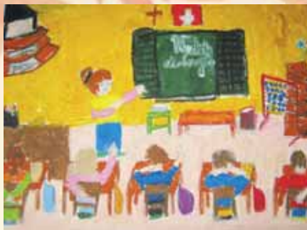
Rys. Alina Figiela, lat 9, SP nr 1 w Rzeszowie

Mama mówi, że właśnie przyszedł do nas wrzesień w płaszczu i ciepłych butach przyniósł dzieciom jesień.