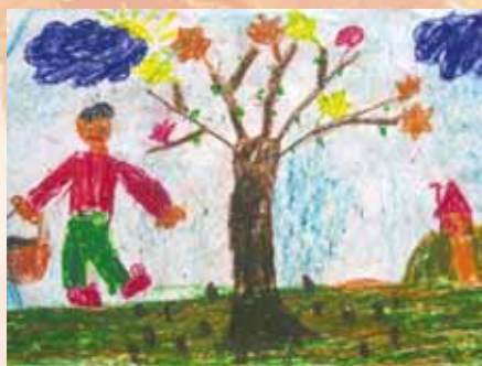
Rys. Adrian Pogoda, lat 9, SP nr 1 w Rzeszowie

Gdy jesienna szaruga zapuka do okien zapalimy w kominku, przepędzimy nudę. Usiądziemy wieczorem w ciepłutkim kąciku, kasztanowych ludzików zrobimy bez liku.